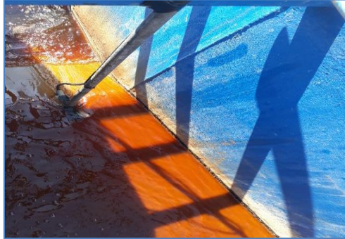
Fotografía 1: Punto de Muestreo