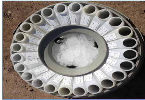
Fotografía 3: Carga de Hielo Equipo Automático