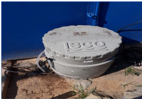
Fotografía 2: Equipo Automático Instalado